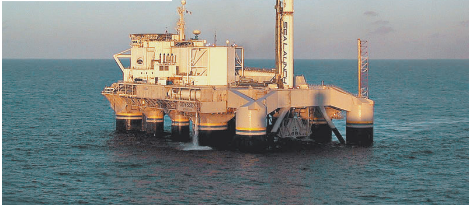
Виталий Лопота уверен, что «Морской старт» не обуза, а достояние страны.